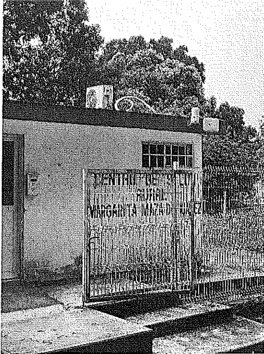
Centro de salud Margarita Maza de Juárez