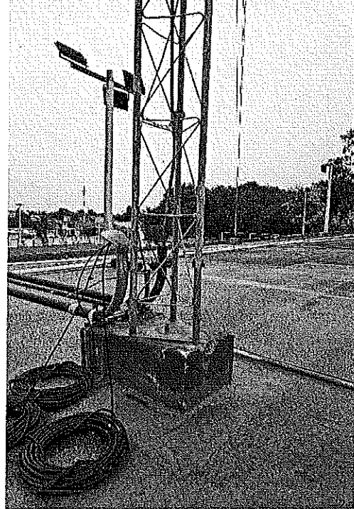
Edificio central DIF